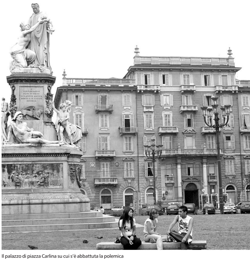
Il palazzo di piazza Carlina su cui s'è abbattuta la polemica

filosofo Gianni Vattimo che non si scandalizza tanto per la decisione di costruire un hotel «che oltraggia la memoria di Gramsci», anche perché palazzo vissero Angelo Tasca e i genitori di Gobetti dopo la morte di Piero. Non si capisce poi l'utilità della scelta: gli alberghi a Torino sono sempre vuoti». Considerazione, quest'ultima, condivisa anche dal